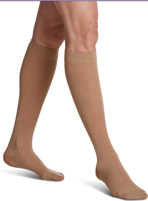
Disponible en pointe ouverte et fermée