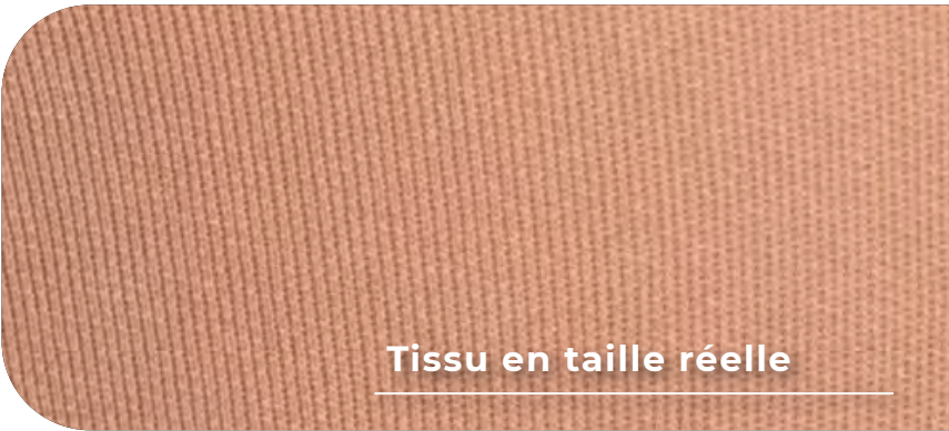
Tissu en taille réelle