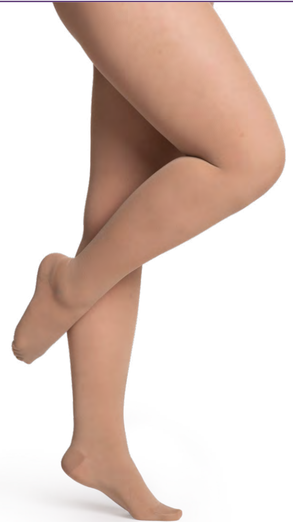
Disponible en pointe ouverte et fermée