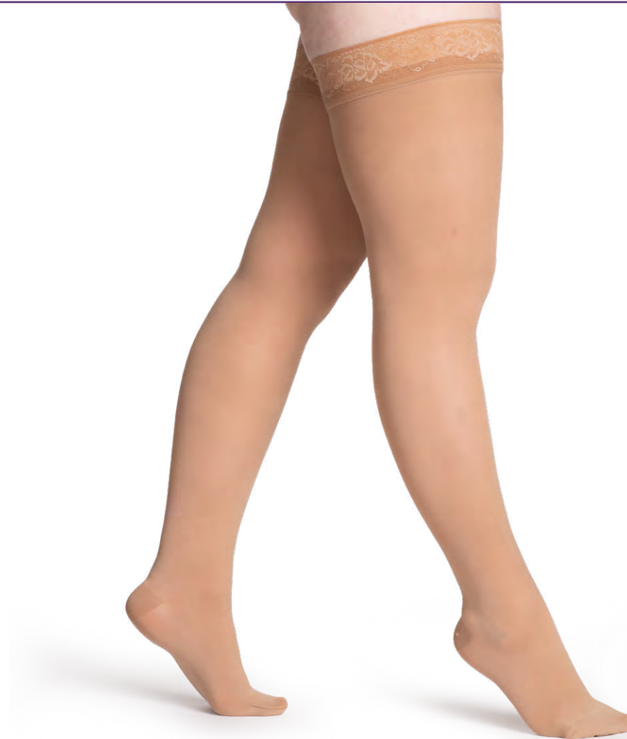
Disponible en pointe ouverte et fermée