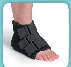
COMPREFLEX PLUS (voir page 58)