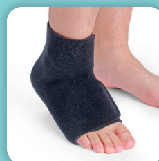
COMPREFLEX BOOT (voir page 56)