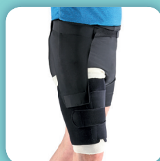
COMPREFLEX THIGH COMPONENT (voir page 52)