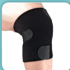
COMPREFLEX (voir page 54)