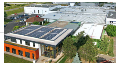
Saint-Just Saint-Rambert - Siège social et site de production principal