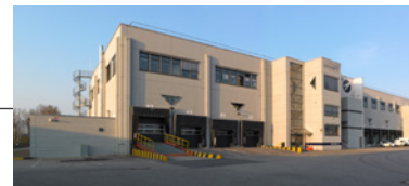
Huningue - Plateforme commerciale, logistique et industrielle