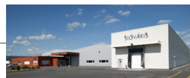
Andrézieux-Bouthéon - Site de production spécifique, entièrement dédié à la préparation des fils et au guipage