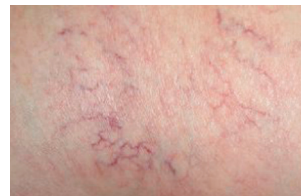
Besenreiser am Oberschenkel 50% der Menschen mit Besenreisern leiden an einer Störung der Venenfunktion.